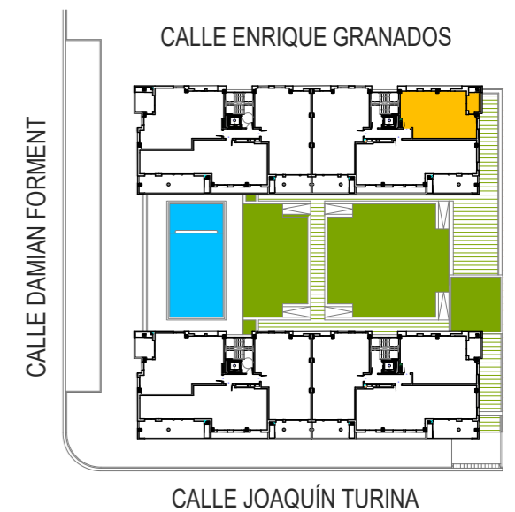
PORTAL 2 PLANTA TERCERA VIVIENDA A